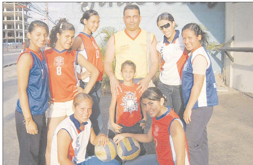
La selección femenina de la Escuela de Voleibol El Tigre se alista para participar en la Copa Aniversario El Tigre.